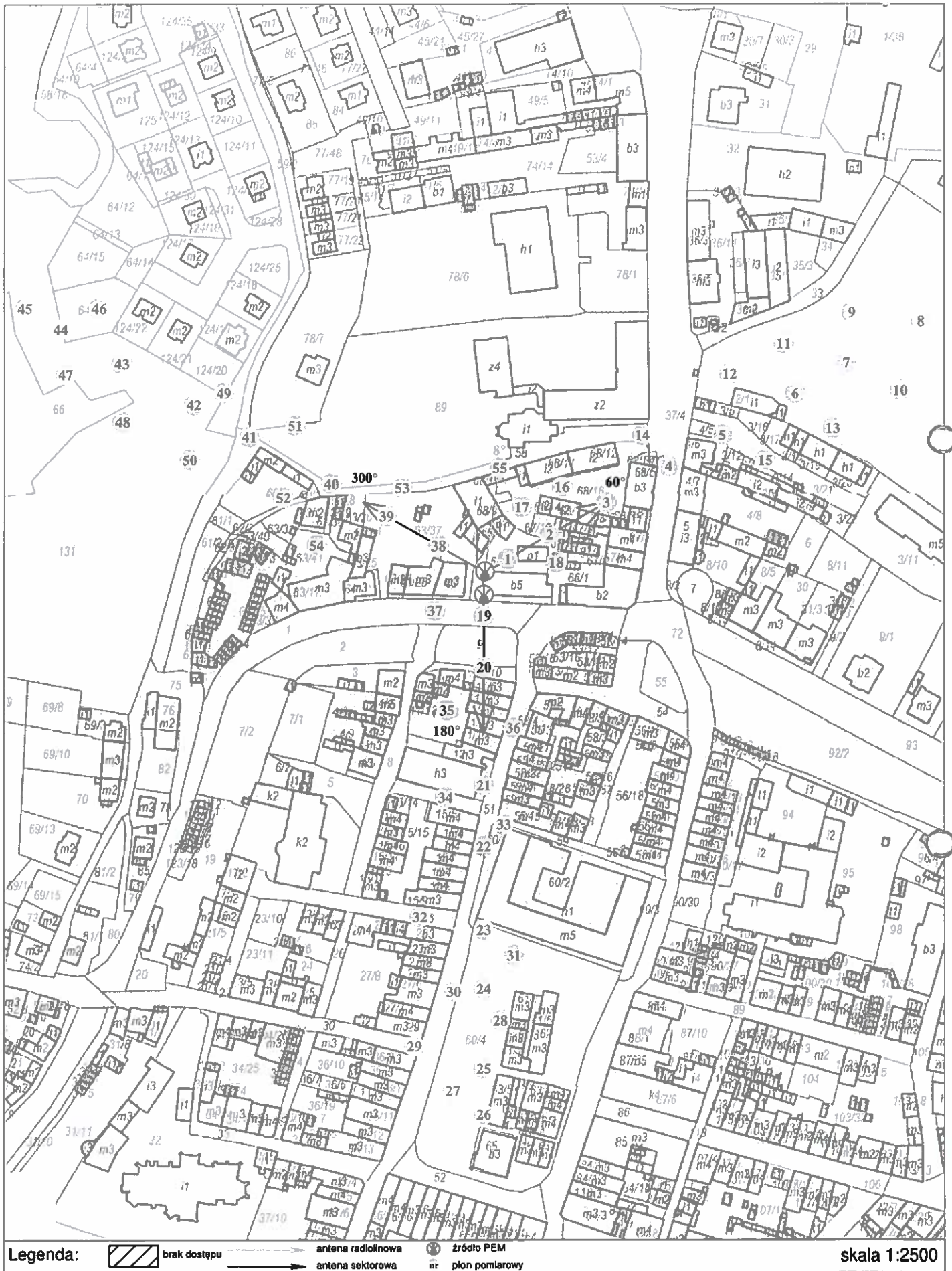
Rys. 2 Lokalizacja pionów pomiarowych